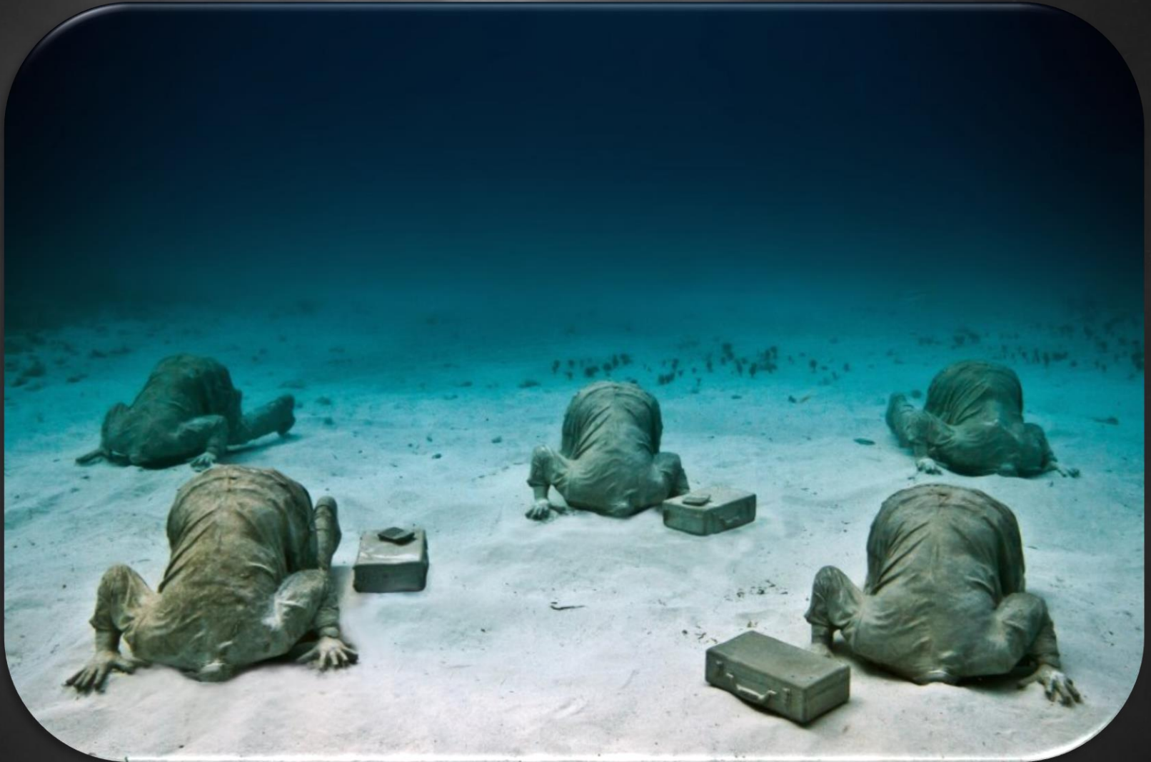
Sculture sommerse di Jason de Caires Taylor