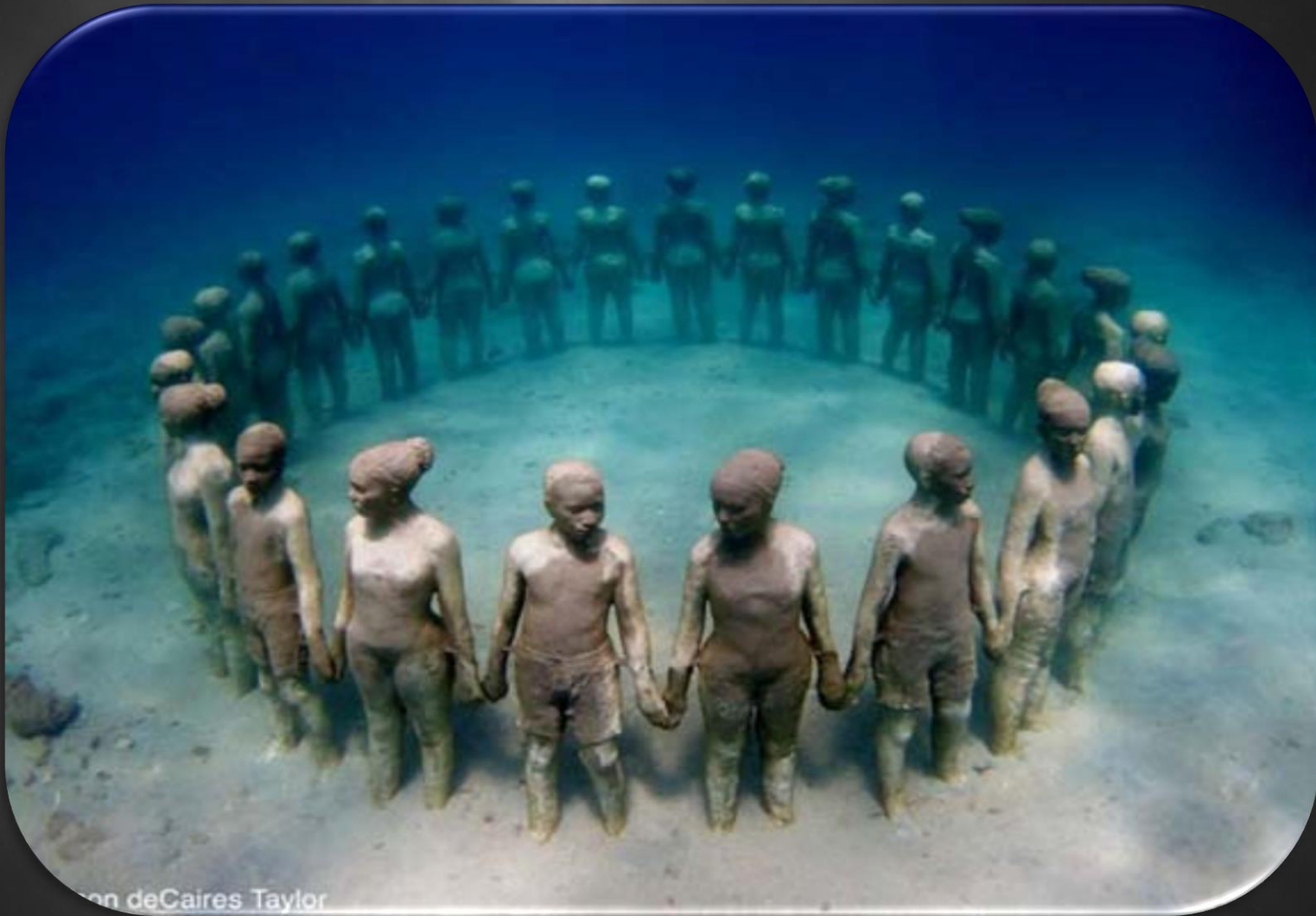
Sculture sommerse di Jason de Caires Taylor