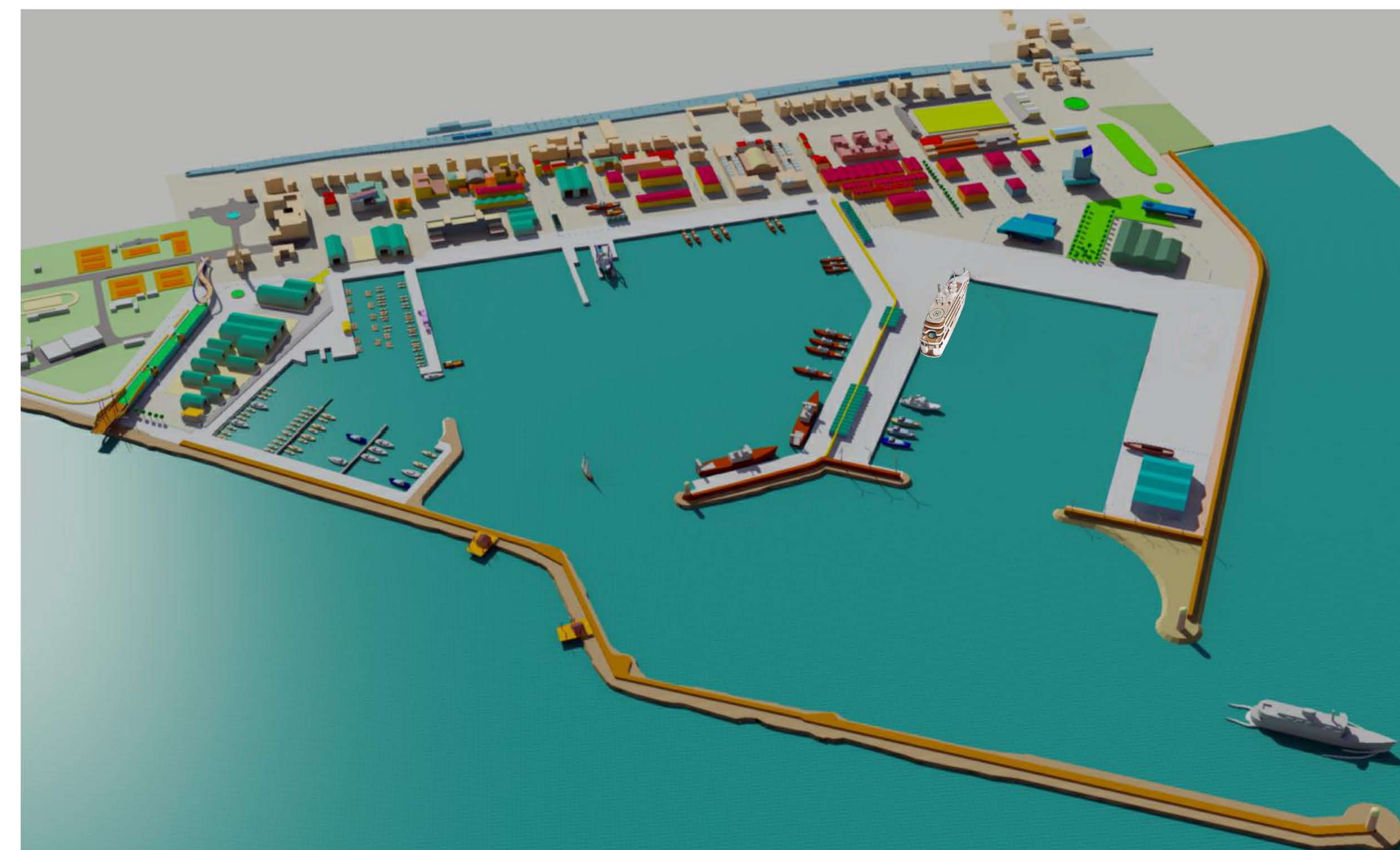
VISTA da Est