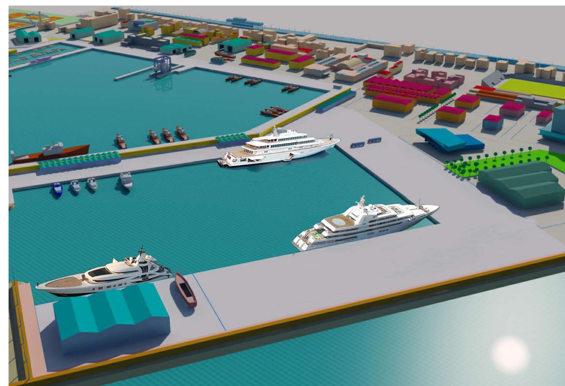
VISTA da Nord